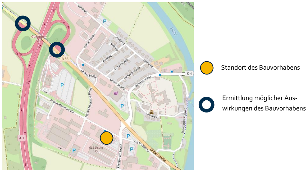
Abbildung 1: Standort des Bauvorhabens und Untersuchungsraum

IKS Mobilitätsplanung wurde beauftragt, ein Verkehrsgutachten für die erwarteten verkehrlichen Auswirkungen auf die nahegelegene Auf-/ Abfahrt der Anschlussstelle 81/ A7 Guxhagen zu erstellen (siehe Abbildung 1). In diesem Rahmen wird auch das erwartete zusätzliche Verkehrsaufkommen im Bereich der gesamten Anschlussstelle betrachtet.